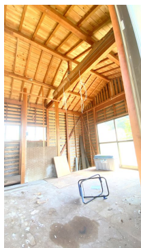
上水：井戸水(公営水道管：前面100mm配管あり。引込なし)

現況と異なる場合には現況を優先します。 該当物件が建築条件付き宅地だった場合、土地売買契約締結後3カ月以内に売主と住宅の建築請負契約を締結していただくことを条件として販売いたします。 この期間内に住宅を建築しないことが確定したとき、または住宅の建築請負契約が成立しなかった場合は、土地売買契約は無効となり、 受領した金額は全額無利息でお返しします。