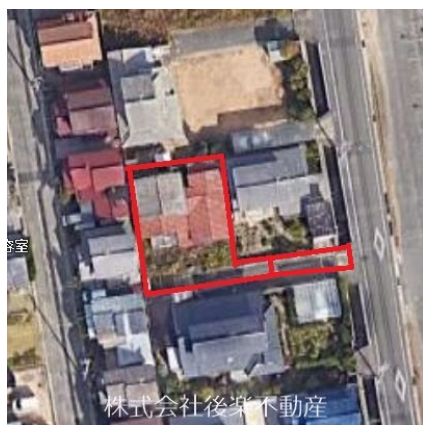
株式会社後楽不動産