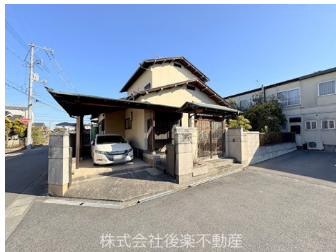
株式会社後楽不動産