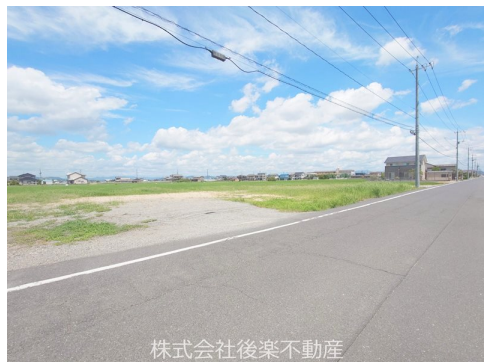
株式会社後楽不動産