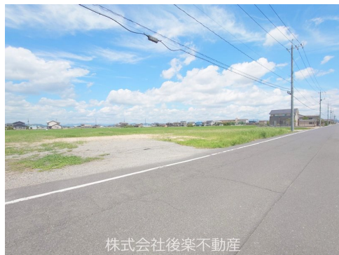
株式会社後楽不動産