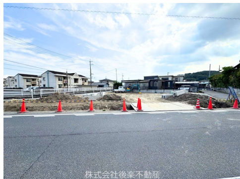
株式会社後楽不動産