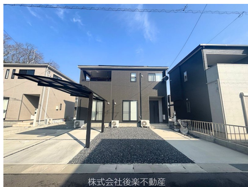
株式会社後楽不動産