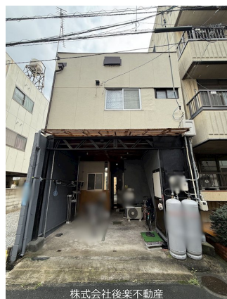
株式会社後楽不動産