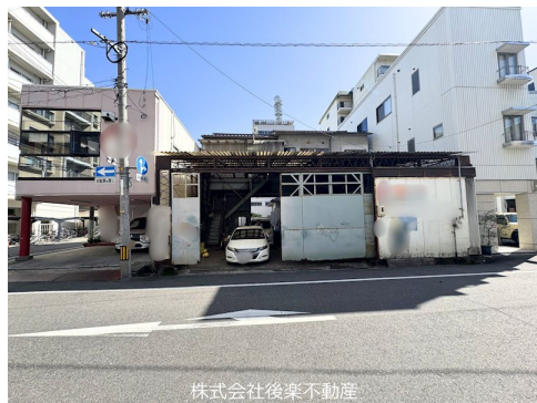
株式会社後楽不動産