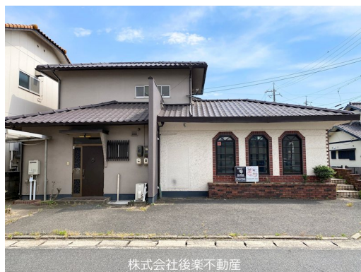
株式会社後楽不動産