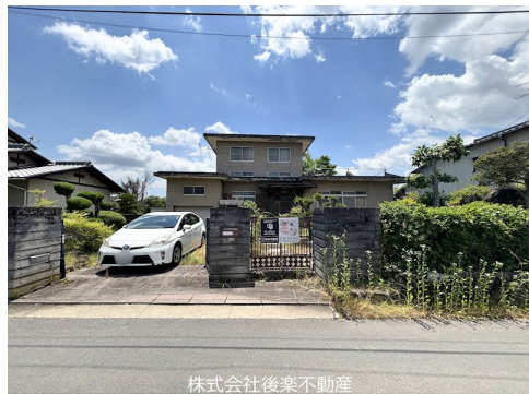
株式会社後楽不動産