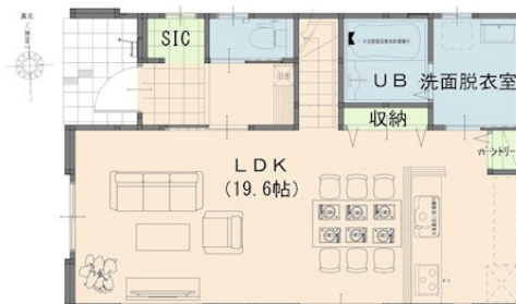
岡山市中区新京橋1丁目1期1号棟 1階平面図